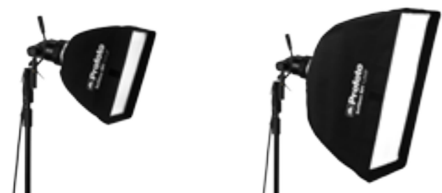
25 47 01 Softbox RFi 1 x 1,3' (30 x 40 cm) 25 47 02 Softbox RFi 1,3 x 2' (40 x 60 cm)

Utilisez la forme rectangulaire pour éclairer une personne de plain-pied, un modèle plus grand comme lumière d'appoint ou un plus petit comme éclairage principal doux et régulier pour un rendu de peau plus homogène. Vous pouvez en utiliser une, deux ou trois, ou en combiner plusieurs pour former une boîte à lumière géante. Le champ des possibilités est infini.