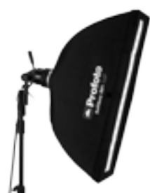
25 47 08 Softbox RFi 1 x 3' (30 x 90 cm) 25 46 32 Stripmask 7 cm pour softbox RFi 1 x 3'

Le stripmask se monte sur la boîte à lumière RFi strip pour créer un faisceau de lumière encore plus étroit. Idéal pour les reflets fins ou lorsque vous voulez régler votre installation sans avoir à déplacer les sources de lumière.