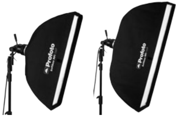
25 47 08 Softbox RFI 1 x 3' (30 x 90 cm)

La boîte à lumière RFi strip est, par ailleurs, un formidable atout lorsque vous prenez des photos dans un espace confiné. Elle prend très peu de place et sa forme étroite vous permet de la placer contre un mur pour créer un éclairage de contre-jour doux et uniforme.