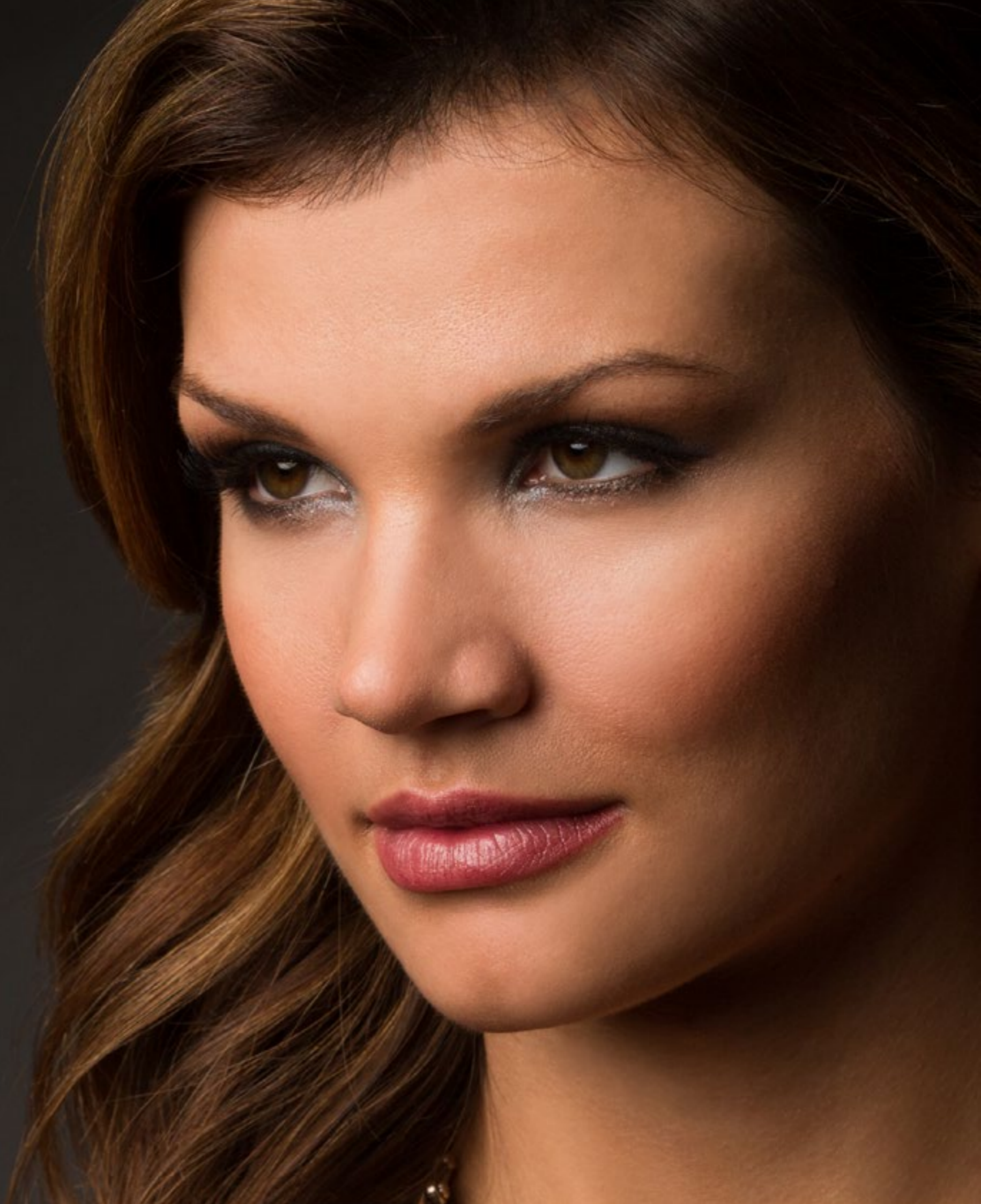
25 47 12 Softbox RFi 5' Octa (150 cm)