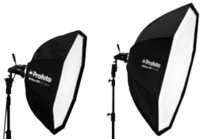
25 47 11 Softbox RFi 3' Octa (90 cm)

En retirant simplement les deux diffuseurs, la RFi Octa se transforme en réflecteur parabolique.