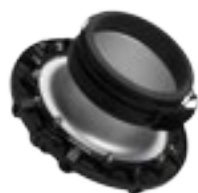
10 05 01 Speedring pour Profoto

Les adaptateurs speedring sont conçus pour que les boîtes à lumière RFi puissent tourner sur 360°, permettant d'ajuster rapidement la position du modèle. Le code couleur permet un assemblage et un démontage faciles. Tous les adaptateurs sont robustes et peints avec une base résistante à la chaleur. Voir au dos pour la liste complète des marques de flashes compatibles.