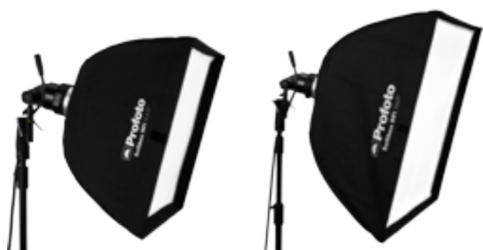
25 47 06 Softbox RFi 2 x 2' (60 x 60 cm)

Le plus petit modèle est particulièrement populaire parmi les photographes de mode et les portraitistes nomades, qui apprécient cet éclairage non seulement facile à contrôler, mais aussi léger, au montage simple et rapide.