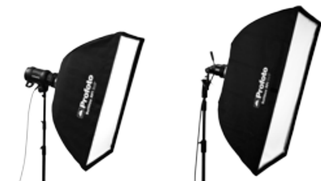
25 47 03 Softbox RFi 2 x 3' (60 x 90 cm) 25 47 04 Softbox RFi 3 x 4' (90 x 120 cm)