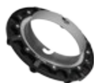
10 05 12 Speedring pour Elinchrom