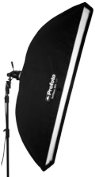
25 47 10 Softbox RFI 1 x 6' (30 x 180 cm)