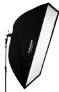
25 47 05 Softbox RFi 4 x 6' (120 x 180 cm)