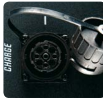
LAMPENANSCHLUSS I / LADEBUCHSE

Lampenanschluss I dient auch als Anschluss für das 100 - 260 V Multi-Voltage Ladegerät PACLA. Die Ladedauer für einen völlig entladenen PROPAC 1 beträgt 4 Stunden, ein PROPAC 2 Akku lädt nach voller Entladung 4,5 Stunden auf. Wenn Sie noch mehr Leistung wünschen laden Sie den PROPAC einfach übernacht auf (für etwa 10 Std.). So können Sie über 25% mehr Blitze verfügen als in den technischen Daten angegeben.