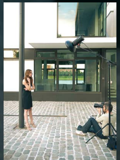
SHOOTING SET-UP: PROFILUX PLUS 800 SOFT BEAM REFLECTOR (COMWEW) PROPAC 1