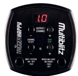
TRIGGER HAPPY 16 Kanal/16 ID Funkfernbedienung